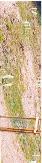
L'area interessata dalla piantumazione dei castagni

Da domani viabilità modificata in via Ponte a San Polo, per effettuare i lavori di manutenzione del sottopasso dell'autostrada A4, che avranno una durata di circa 60 giorni. A partire dalle 8 del 24 aprile e fino al termine dei lavori, nella zona interessata dagli interventi, sarà istituito il senso unico alternato di marcia, regolato mediante l'uso di impianto semaforico attivo 24 ore su 24 per impedire la congestione del traffico lungo la via.